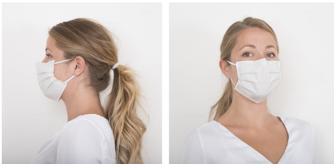
Masque en tissu à l'intention du grand public dans le cadre de la lutte contre la propagation du Covid-19